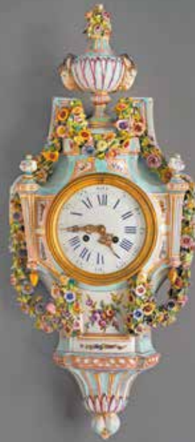
Cartel d'applique de style Louis XVI, Allemagne, fin du XIX e siècle H. 67 cm