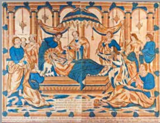
Imagerie d'Orléans, XVIII e siècle La dormition de la Vierge, H. 59 cm L. 79 cm