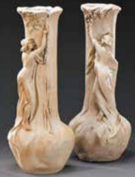
Paire de vases Art Nouveau H. 55 cm