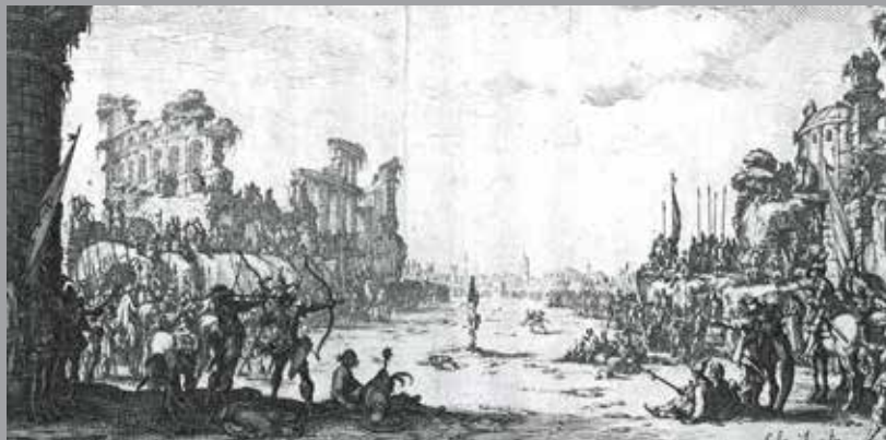
Jacques CALLOT (1592-1635) Le martyre de saint Sébastien , Eau-forte, H. 16,2 cm L. 32,5