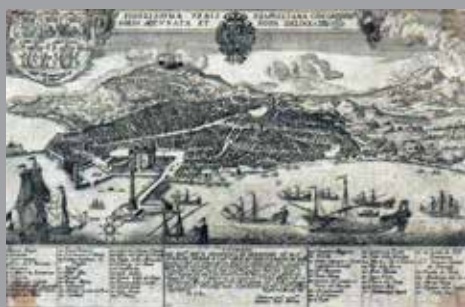
École ITALIENNE du XVII e siècle , Vue aérienne de Naples , Gravure sur cuivre, H 20 cm L. 31,5 cm