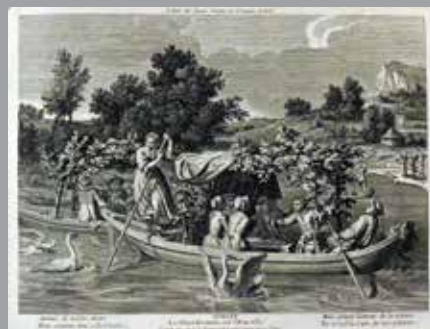
Imagerie de la rue Saint-Jacques (Desnos) Suite complète des douze mois de l'année H. 24 cm L. 32 cm