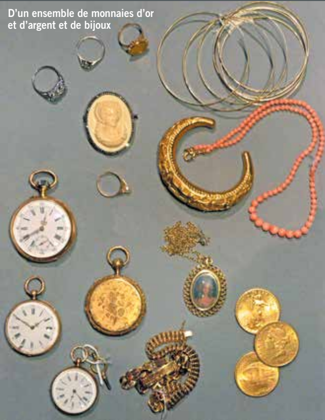
D'un ensemble de monnaies d'or et d'argent et de bijoux