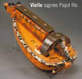
Vielle signée Pajot fils