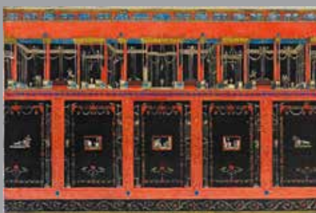
Planches du tableau historique des costumes, des mœurs et des usages, vers 1800