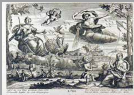
Imagerie de Lyon , chez Daudet rue Mercière Très rare suite des quatre éléments H. 23 cm L. 31 cm