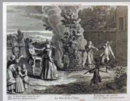
Imagerie de la rue Saint-Jacques (Desnos) Les quatre saisons H. 24,5 cm L. 32 cm