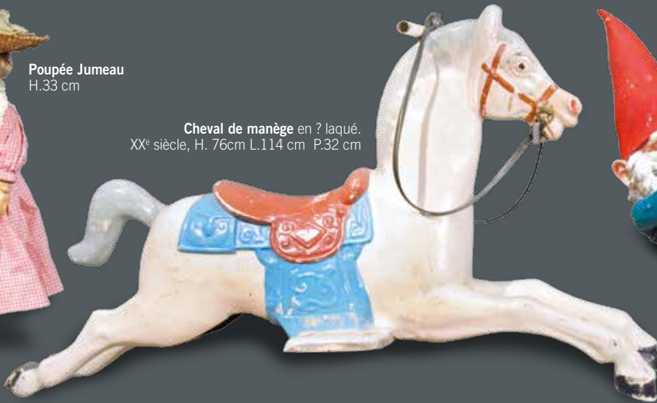
Cheval de manège en ? laqué. XX e siècle, H. 76cm L.114 cm P.32 cm