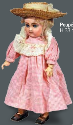
Poupée Jumeau H.33 cm