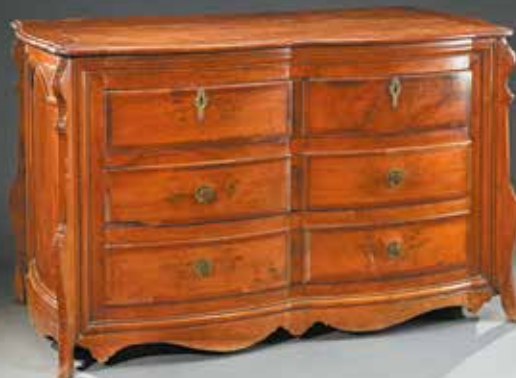
Travail du Languedoc, début du XVIII e siècle H. 83,5 cm L. 134 cm l. 70 cm