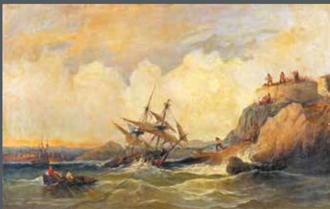
École FRANÇAISE du XIX e siècle Le naufrage Huile sur toile, H. 47 cm L. 73 cm