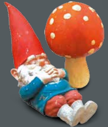
Travail HOLLANDAIS des années 1970 Grand nain de jardin et amanite tue-mouches Résine polychrome, L. 76 cm