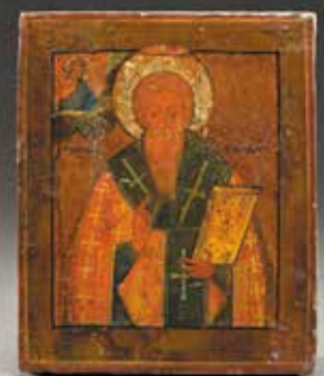
RUSSIE, fin du XIX e siècle, début du XX e siècle, H. 22 cm L. 18 cm