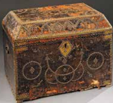
Coffre en cuir clouté d'étoiles