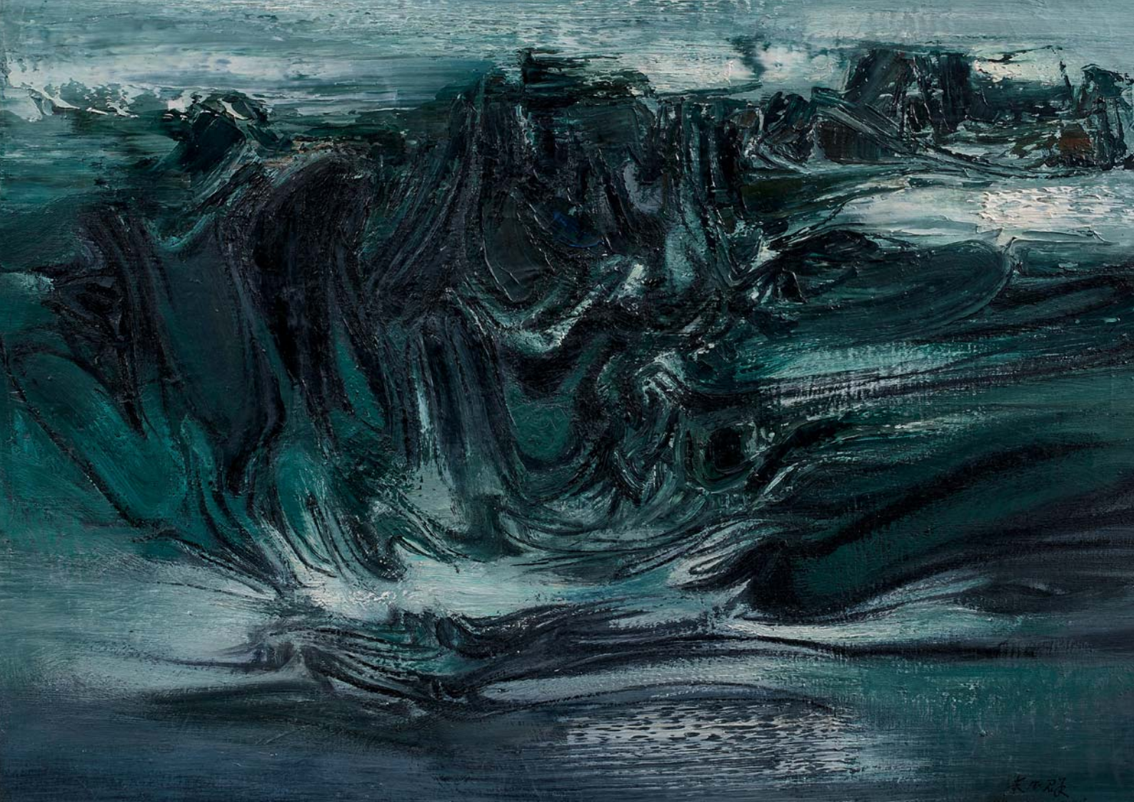
En vente le 20 octobre 2019 : CHU Teh-Chun (1920-2014). Composition, n°112, 1962 . Huile sur toile. 65 x 81 cm (détail)